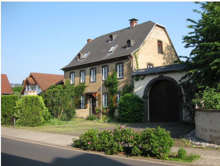
Weyerburg in Sinzig (2021)