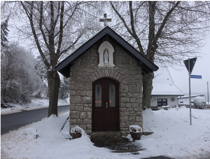
Wegekapelle "Am weißen Kreuz"