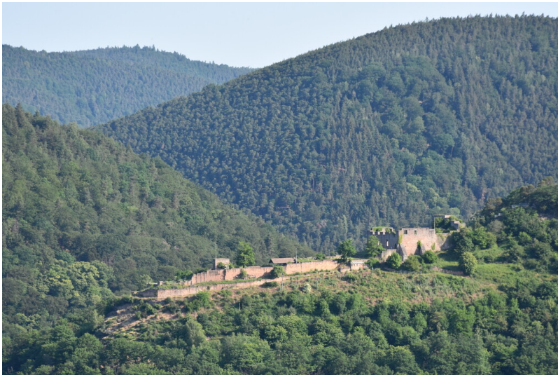
Blick auf die Burgruine Wolfsburg bei Neustadt an der Weinstraße