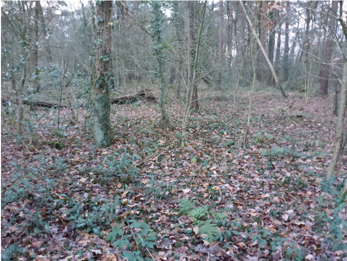
Quellort am Sprünkenhof (2019)