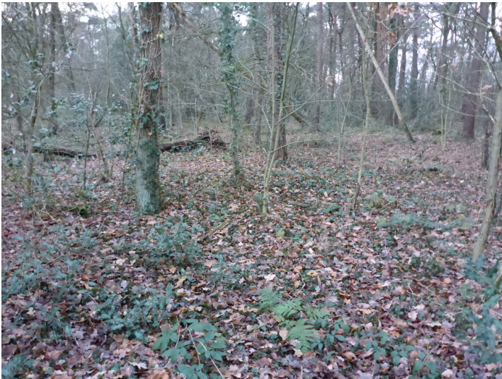
Quellort am Sprünkenhof (2019)