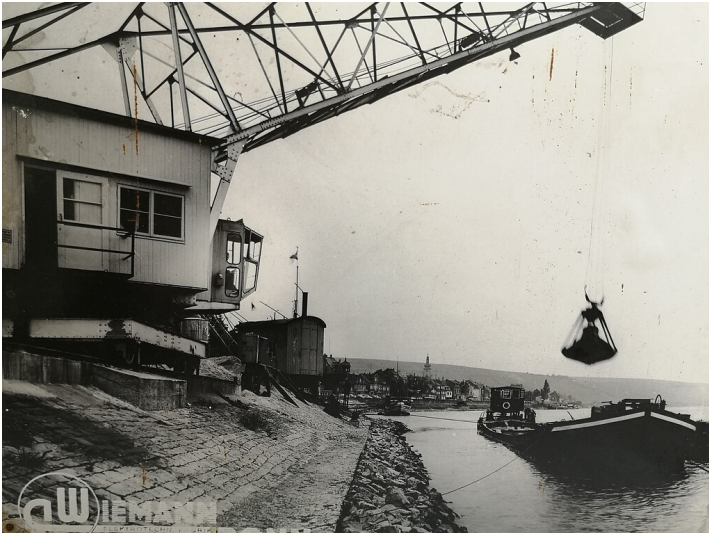
Kran an der Verladestelle der Sandbaggerei Lerch am Niersteiner Rheinufer (1960er/1970er Jahre)