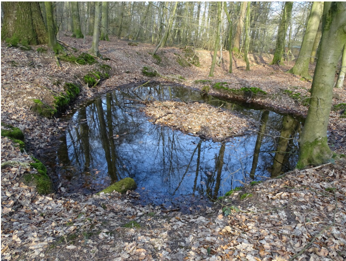
Gefüllter Quellteich (2022)