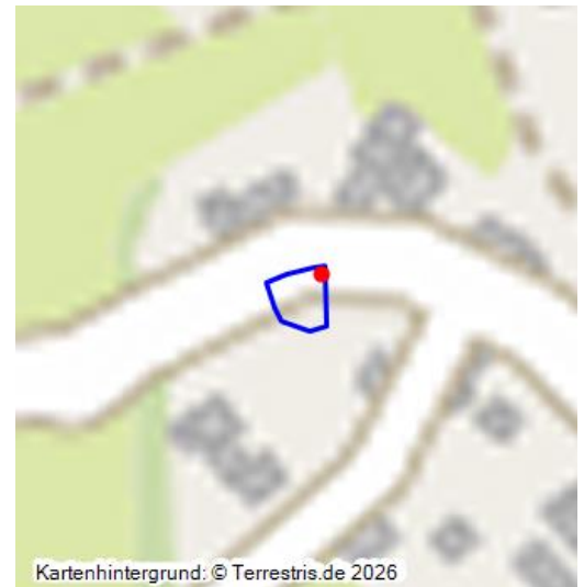
Roderather Marmorbruch, ca. 1911

Der Plateauwagen erinnert an den Abbau des so genannten Roderather Marmors . Zwischen den Jahren 1911 und 1913 wurde das Gestein in einem Steinbruch nördlich von Roderath von einer Gewerkschaft kommerziell gebrochen und über eine Lorenbahn von Pferden bis in den Ort gezogen. In der Umgebung des Platzes, an dem sich der Plateauwagen befindet, wurde das Material auf Fuhrwerke verladen und abtransportiert. Der Plateauwagen wurde im Jahr 1983 von der lokalen freiwilligen Feuerwehr aufgestellt, wobei unklar ist, ob es sich um ein Original oder eine Nachbildung handelt.