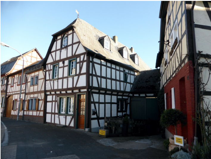
Fachwerkhaus Hauptstraße 91 in Sinzig-Bad Bodendorf (2023)