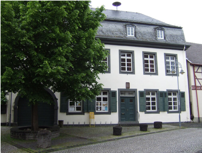
Bad Bodendorfer Hof (2013)