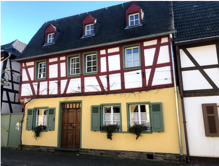
Fachwerkhaus Hauptstraße 69 in Bad Bodendorf (2023)