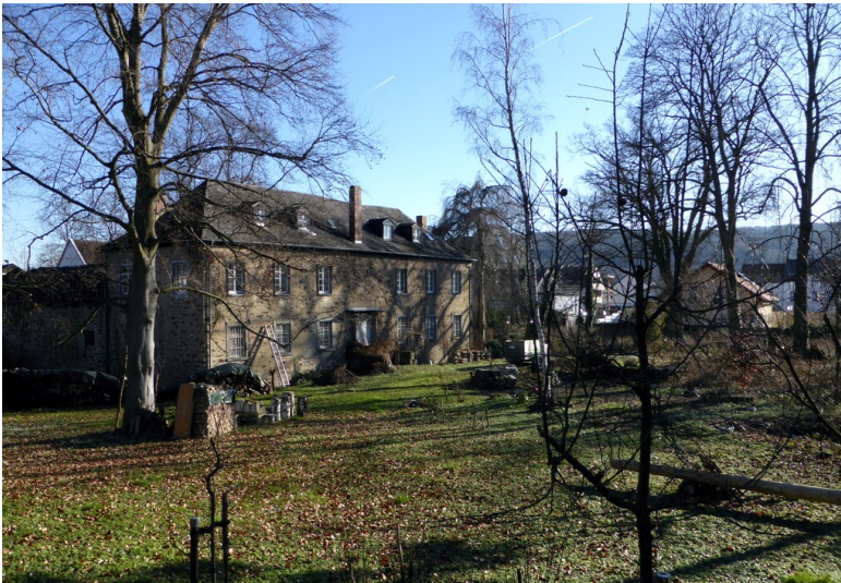
Burg Bodendorf in Bad Bodendorf (2023)