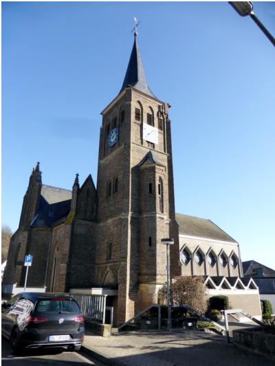
Katholische Pfarrkirche Sankt Sebastian in Sinzig-Bad Bodendorf (2023)

Schlagwörter: Pfarrkirche , Hallenkirche , katholisch Fachsicht(en): Kulturlandschaftspflege , Denkmalpflege Gemeinde(n): Sinzig Kreis(e): Ahrweiler Bundesland: Rheinland-Pfalz