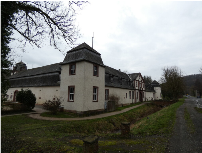
Schloss Ahrenthal in Sinzig-Franken (2024)