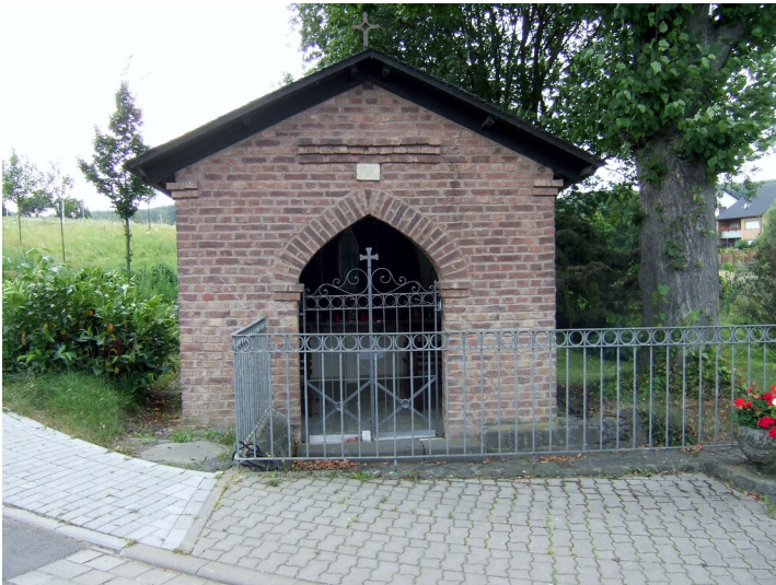
Kapelle in der Maisgasse in Sinzig-Franken (2013)