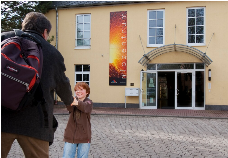
Das Vulkanpark Infozentrum an der Rauschermühle in Plaidt (2022)