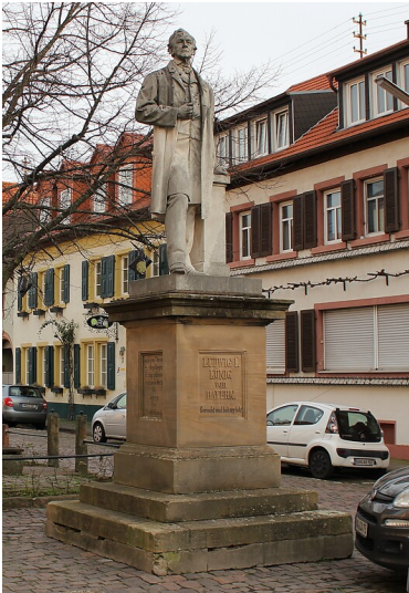
Denkmal König Ludwig I. in Edenkoben