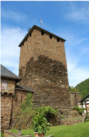
Bergfried der Treiser Wildburg, Ansicht von Südwesten (2022)