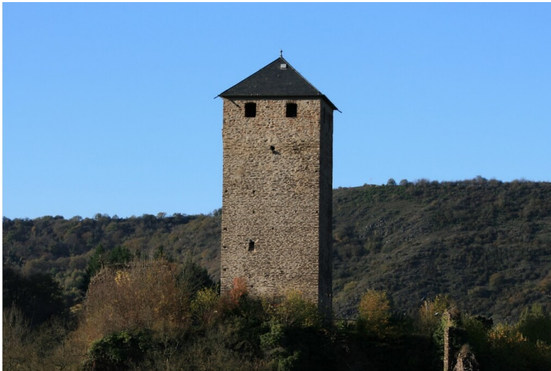
Bergfried der Burg Treis, Südostansicht (2022)