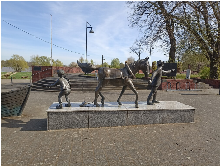
Gesamtansicht des Treideldenkmals auf dem Stürzelberger Dorfplatz (2022).