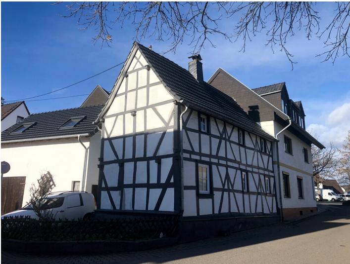
Fachwerkhaus Römerstraße 1 in Koisdorf (2023)