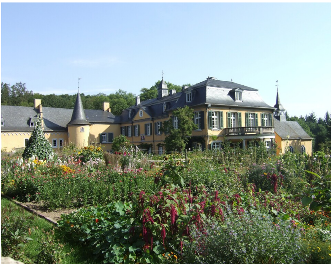
Schloss Vehn in Sinzig-Löhndorf (2013)