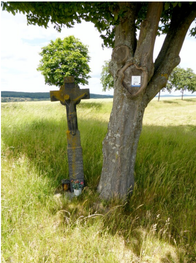
Matthiaskreuz am Beuler Hof in Löhndorf (2020)