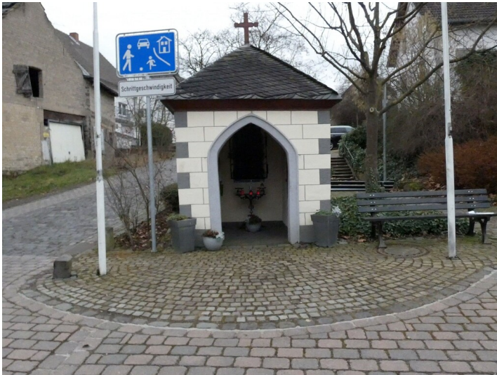
Kapelle Am Landgraben in Löhndorf (2022)