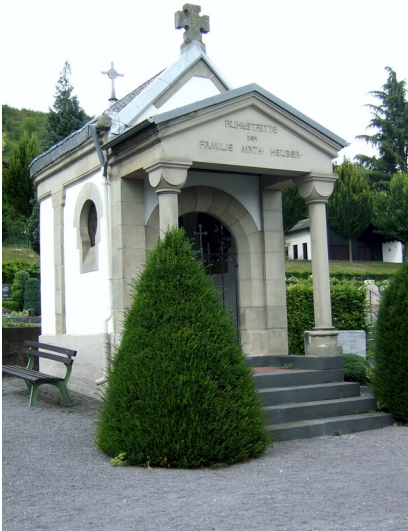
Ruhestätte der Familie Matthias Heuser auf dem Friedhof in Westum (2013)