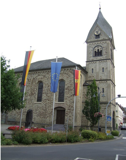
Katholische Pfarrkirche Sankt Peter in Sinzig-Westum (2013)