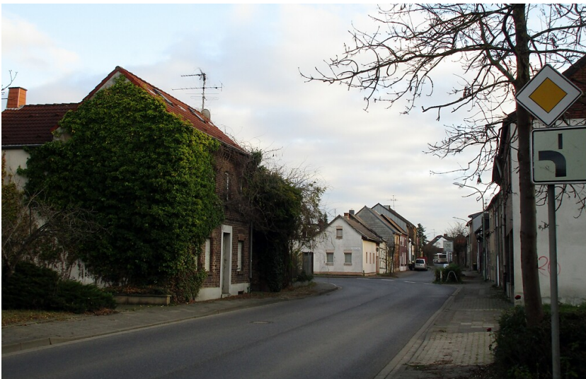
Blick in die verlassene Oberstraße von Morschenich, einem im Zuge des Braunkohle-Tagebau Hambach 2015 nach Morschenich-Neu umgesiedelten Ortsteil der Gemeinde Merzenich im Kreis Düren (2021).