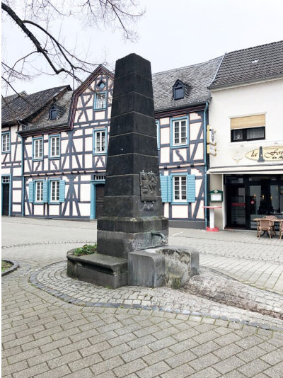
Brunnen in der Ausdorfer Straße in Sinzig (2023)