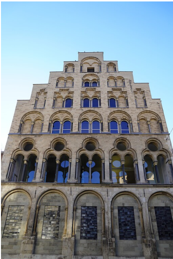
Die Frontansicht der Fassade des Overstolzenhauses in Köln (2023)