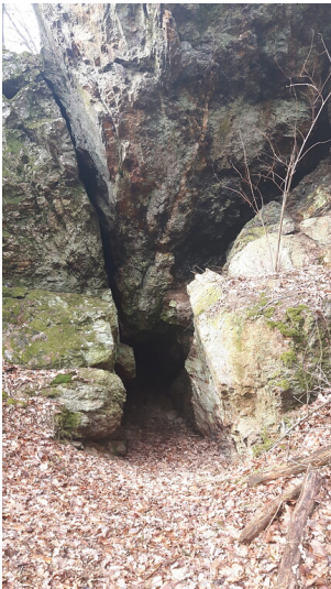
Kleiner Stein bei Briedel