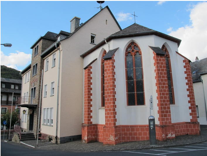
Die Katharinenkapelle in Treis (2022)