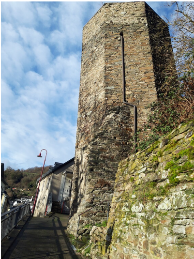
Einstiger Standort der Beulspforte am Beulsturm in Dausenau (2022)