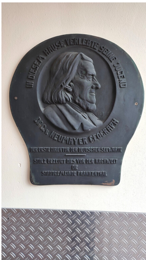
Gedenktafel Georg von Neumayers in Frankenthal

Schlagwörter: Wohnhaus Fachsicht(en): Landeskunde Gemeinde(n): Frankenthal (Pfalz) Kreis(e): Frankenthal (Pfalz) Bundesland: Rheinland-Pfalz