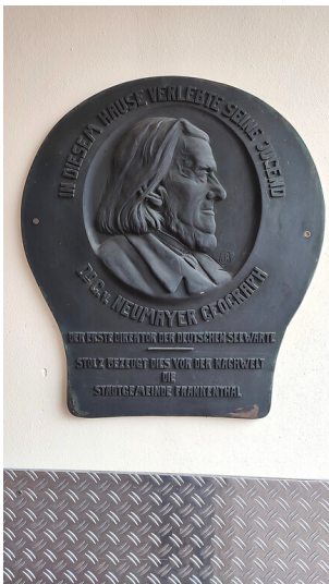
Gedenktafel Georg von Neumayers in Frankenthal