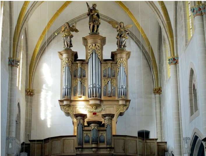
Die Stumm-Orgel in der Stifts- und Pfarrkirche in Sankt Castor in Karden (2022)