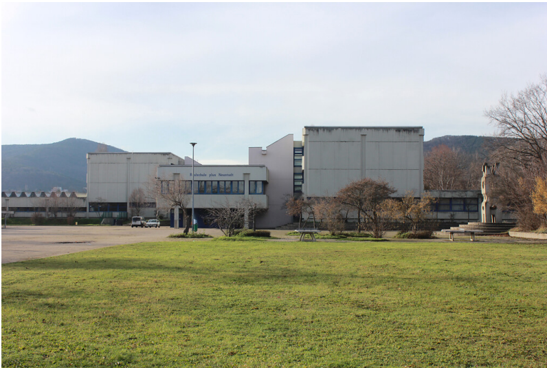
Georg-von-Neumayer-Realschule plus in Neustadt an der Weinstraße