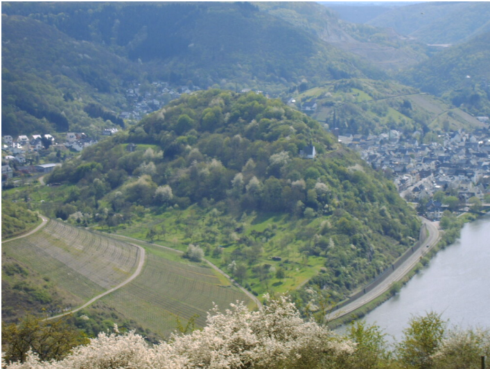
Die Zilleskapelle auf dem Zillesberg bei Treis, links im Bild schließt flussabwärts der Eierberg an (2008).