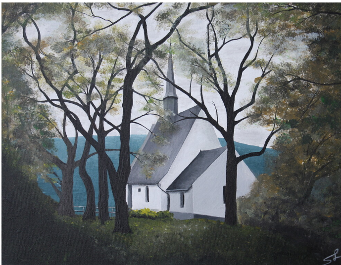
Gemälde der Zilleskapelle nördlich von Treis (2022)