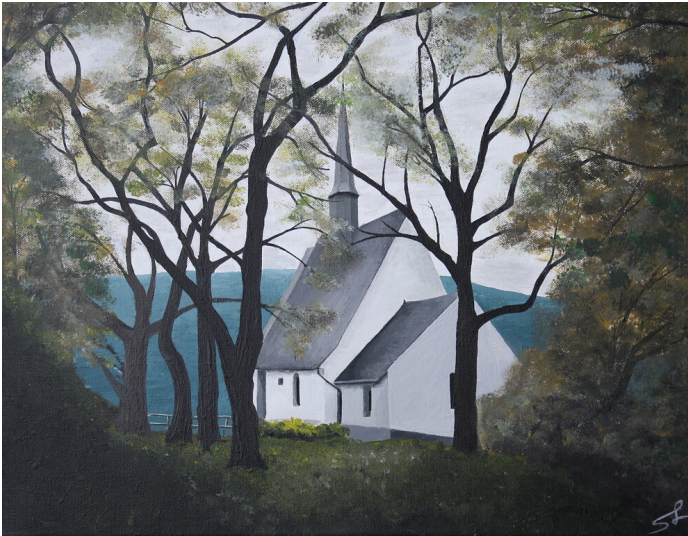
Gemälde der Zilleskapelle nördlich von Treis (2022) Fotograf/Urheber: Sarah Layendecker