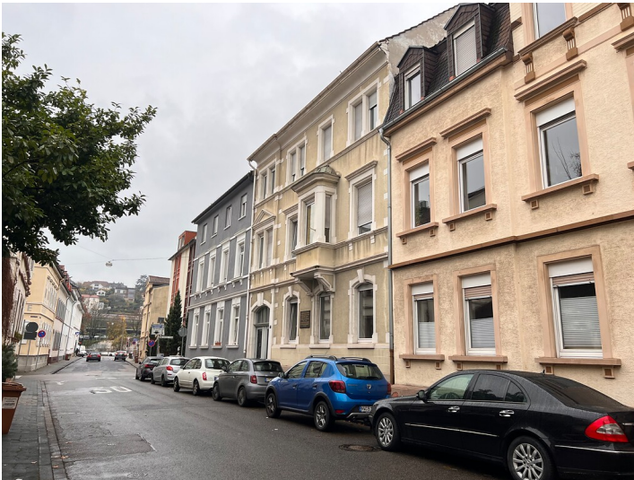
Wohnhaus Georg von Neumayer in Neustadt an der Weinstraße