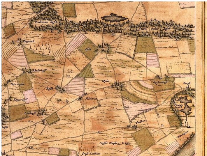
Ausschnitt eines Kupferstichs von Joan Blaeu (1596-1673), die auf 1663 datierte Karte "Descriptio Agri Civitatis Coloniensis" zeigt die Umgebung von Köln.