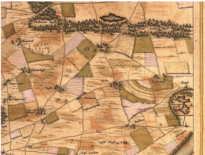
Ausschnitt eines Kupferstichs von Joan Blaeu (1596-1673), die auf 1663 datierte Karte "Descriptio Agri Civitatis Coloniensis" zeigt die Umgebung von Köln.