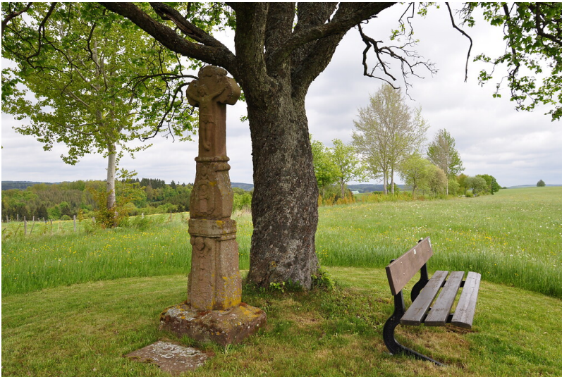
Sandsteinkreuz mit Elsbeere in Ripsdorf (2014)