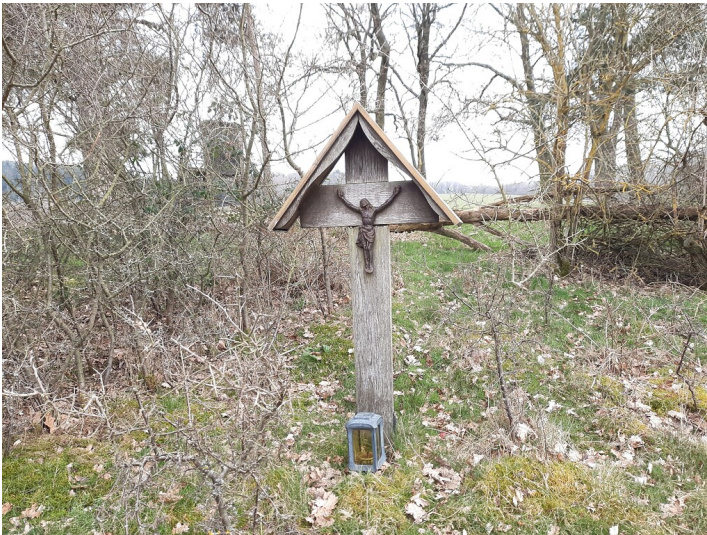
Ein einfaches Holzkreuz mit Dach und Christuskorpus aus Eisen steht am Rand einer Weidefläche (2022).