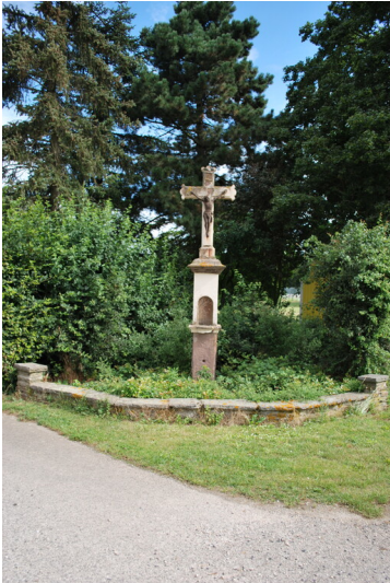
Wegkreuz an Haus Boulig (2015)