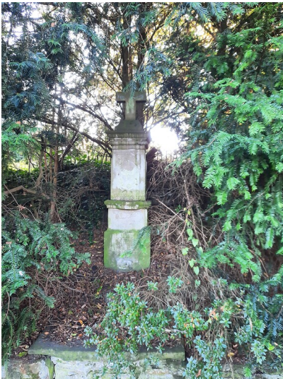
Steinernes Wegkreuz am Hang (2022).