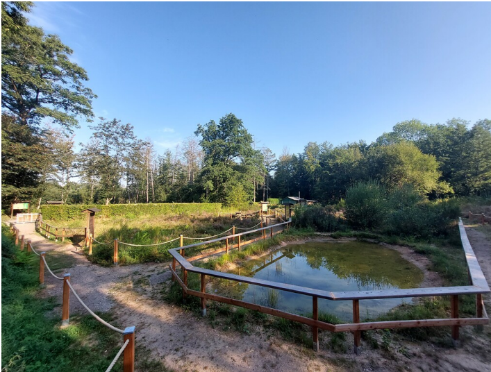
Das Gelände des Heide-Lehrpfades an der Ohligser Heide (2022)