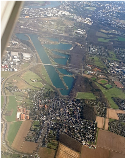
Blick vom Flugzeug aus auf den Kölner Stadtteil Fühlingen im Vordergrund und das Naherholungsgebiet Fühlinger See dahinter (2018). Links im Bild verläuft die Bundesstraße B 9, im Hintergrund sind Köln-Merkenich und -Seeberg und der Rhein zu sehen.