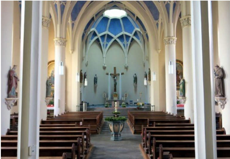
Blick auf das Taufbecken und den dahinter liegenden Chor der Pfarrkirche Sankt Johannes der Täufer in Treis (2022)