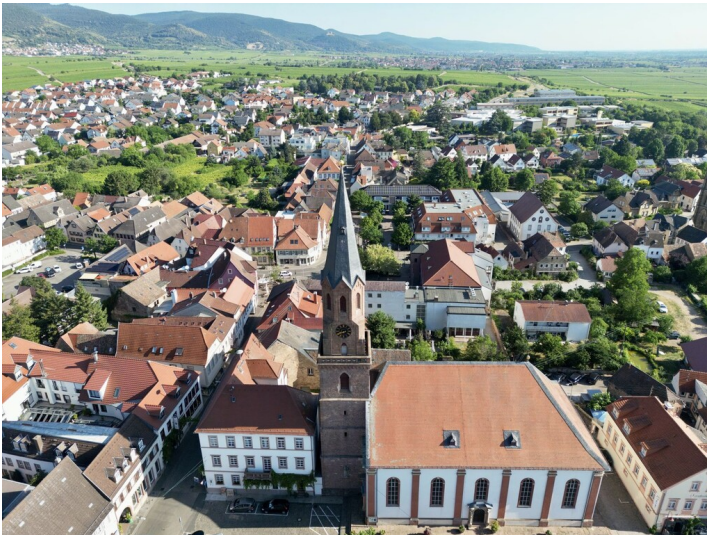
Luftansicht vom Ludwigplatz aus auf die protestantische Kirche und das Rathaus der Stadt Edenkoben als Eckbau (2022)