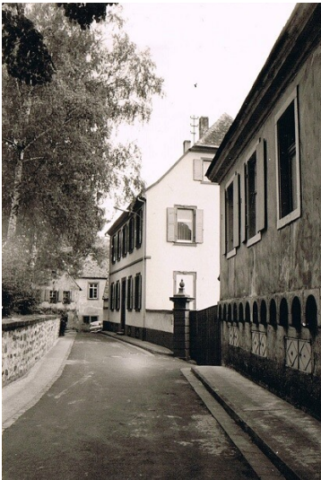
Historische Aufnahme des ehemaligen fürstbischöflichen Wachthauses (vorne) und des barocken Pfarrhauses (hinten) in der Kirschstraße in Kirrweiler (1960er Jahre)