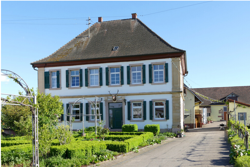
Die ehemalige fürstbischöfliche Schaffnerei in Kirrweiler (2021)